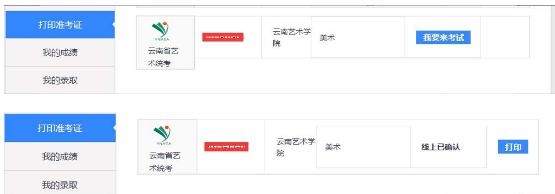
图 7-1 打印准考证页面