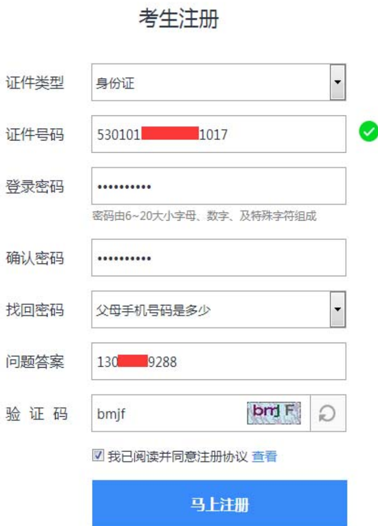
图 2-2 考生注册页面