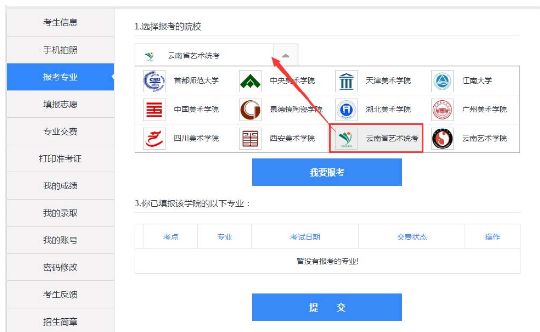
图 5-1 选择报考院校、考点及专业页面

第四步提交： 本步骤系统对考生信息进行校验，凡未到户口所在地县（市、区）招办进行艺术类资格报名的考生，均无法完成提交，责任由考生自负。