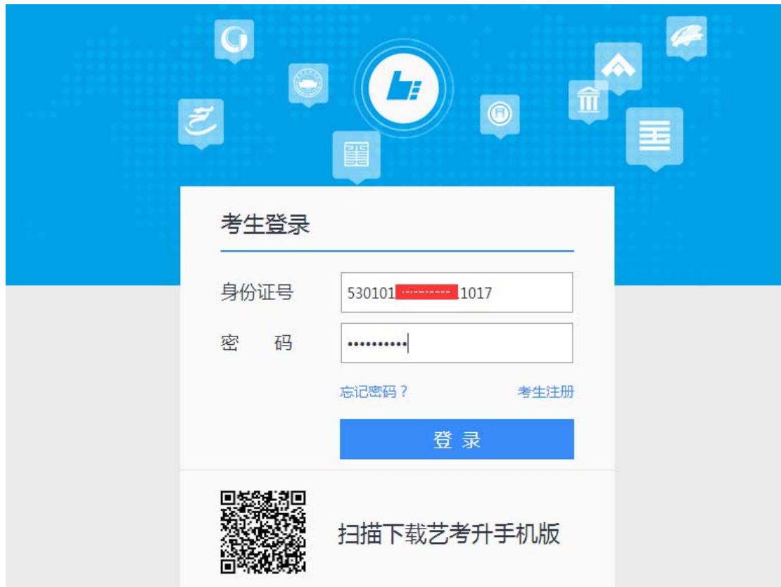
图 3-1 考生登录页面