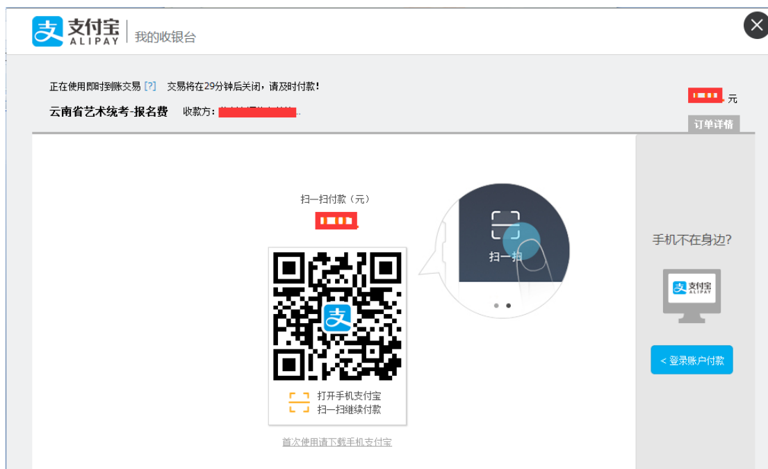
图 6-2 支付宝支付页面