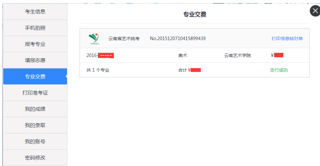
图 6-3 专业交费页面显示支付反馈